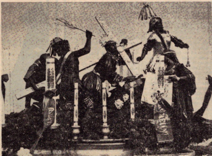
Un gruppo della Processione dei Misteri di Trapani

Abbiamo già ricordato le processioni dei «Misteri» di Trapani ed Erice. Ma in provincia di Trapani anche Marsala è nota per una processione, quella dei «Giovedì Santo» che a differenza delle prime due, è una sacra rappresentazione animata.